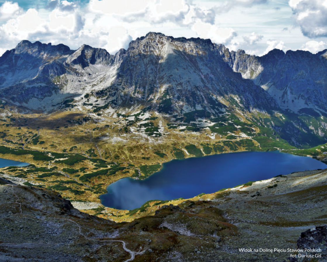
Widok na Dolinę Pięciu Stawów Polskich