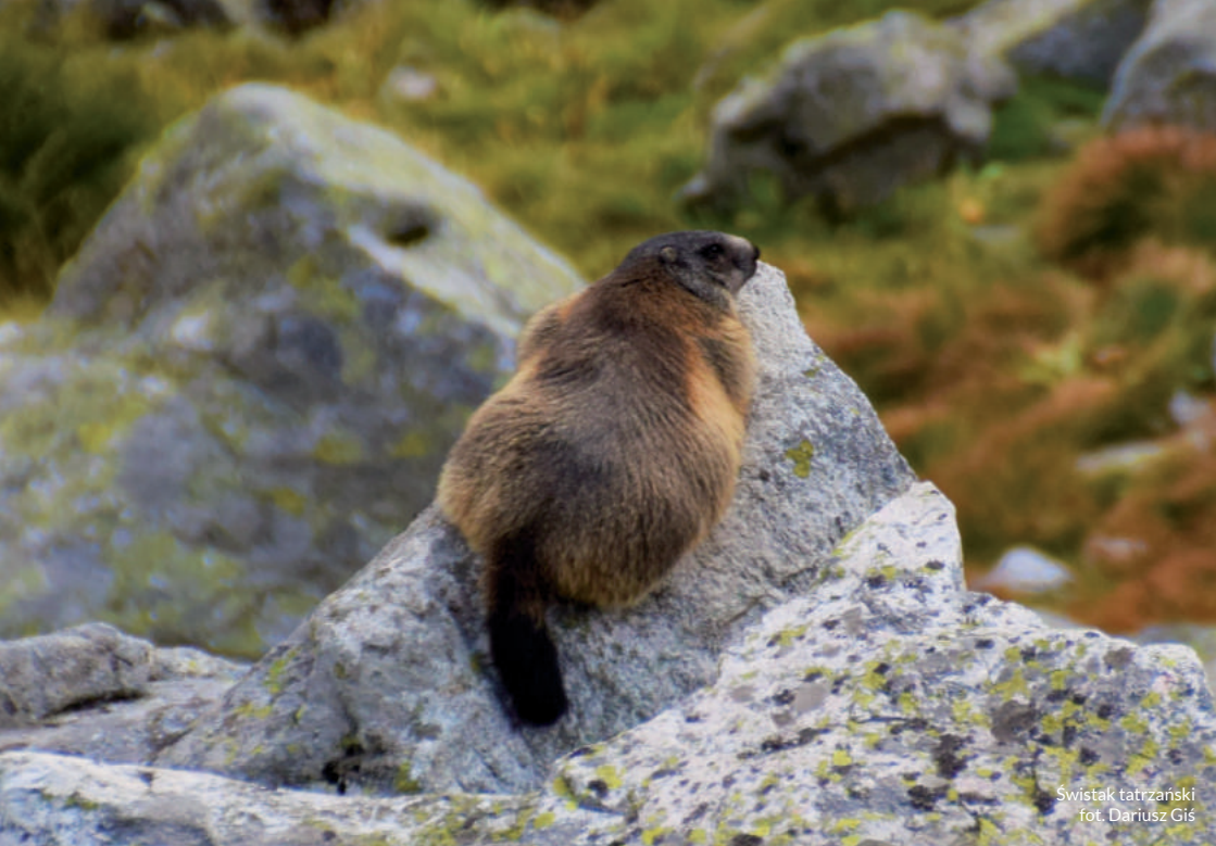
Świstak tatrzański