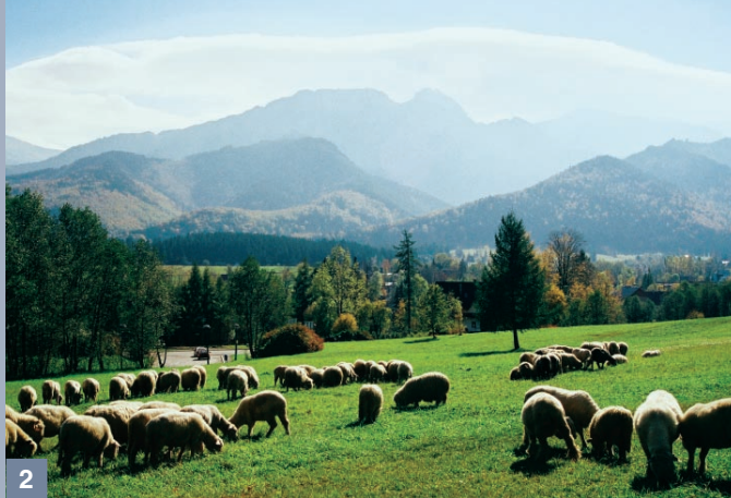
2. Charakterystyczny wał utworzony z chmur. Nad Podhalem panuje piękna pogoda

różnicy wysokości. Gdy osiągnie poziom kondensacji, temperatura spada nieco wolniej – zgodnie z krzywą tzw. „wilgotnej adiabaty” – średnio o 0,6 stopnia na każde 100 m. Jeśli przeszkoda w postaci łańcucha górskiego jest wystarczająco wysoka, to powietrze będzie się dalej wznosiło, chmury będą gęstniały i pojawi się opad deszczu. Powietrze pozbawia się wilgoci, jego masy osuszają się, wiatr po stronie zawietrznej stanie się suchy i ciepły.