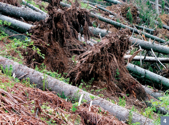
4. Efektem wiatru halnego w tatrzańskich lasach są wiatrolomy i wiatrowały

Po zaistnieniu wiatrolomów wzmaga się również oddziaływanie korników, co dodatkowo zmienia obraz lasu.