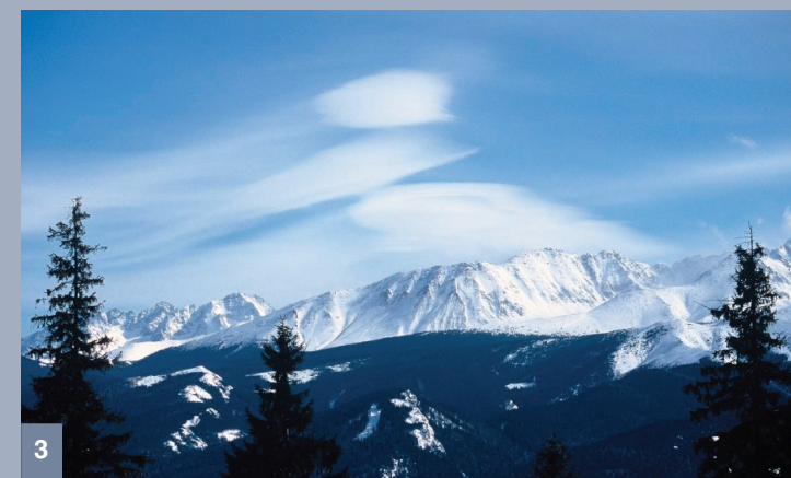
3. Chmury Alto cumulus lenticularis nad Tatrami w marcu 2005 r.

W TPN wiatr halny odbierany jest jako bardzo interesujące zjawisko przyrodnicze, godne wnikliwej obserwacji i analizy. Jednak jego skutki są często nader uciążliwe. Wielohektarowe zniszczenia w drzewostanach objętych ochroną częściową, wymagają potem żmudnych zabiegów: porządkowania powierzchni, dosadzania młodych drzewek i pielęgnowania ich przez kilka lat. Prace te wymagają sporych nakładów materialnych, finansowych i zaangażowania zwiększonej ilości ludzi.