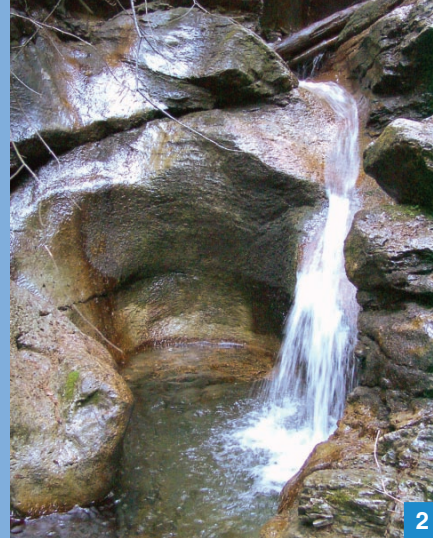
2. Wodospad na Potoku Filipczarskim